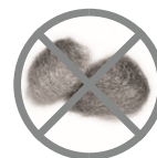
PALHA DE AÇO

Qualquer dúvida entre em contato com a Ritallio pelo telefone +55 48 3345-3069 ou através do nosso site www.ritallio.com.br